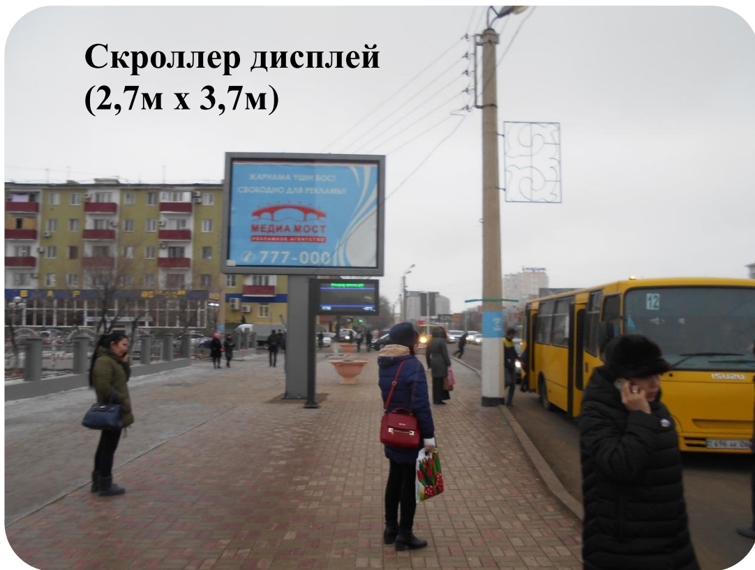
Скроллер дисплей (2,7м x 3,7м)